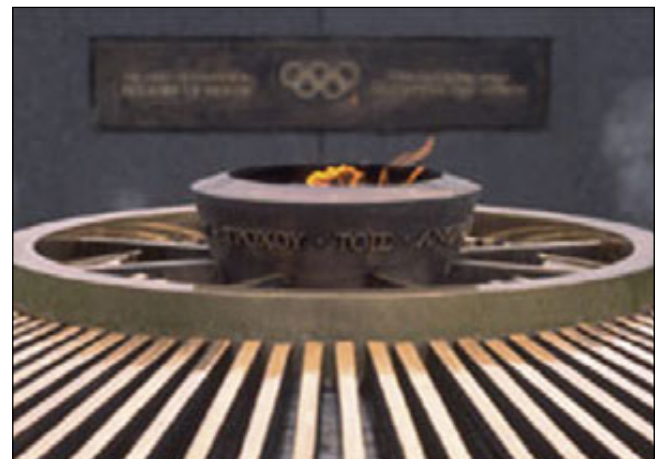
Flamme Olympique au CIO à Lausanne

Le musée présente des expositions temporaires et des expositions permanentes. FIN