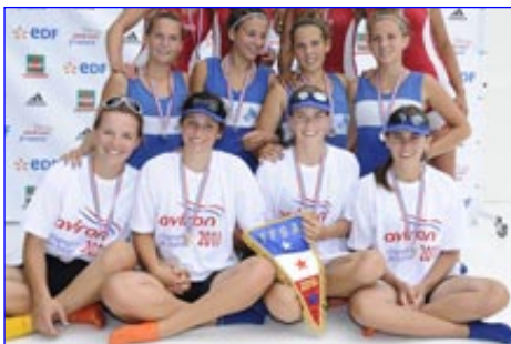
4X Cadettes Av Grenoble