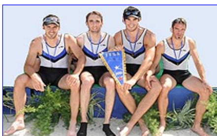
4-HS Av. Grenoble