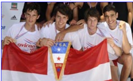
4- Juniors CN Annecy