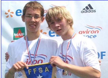
HM2x du CA Thonon