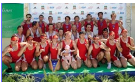
8+SH CN Annecy