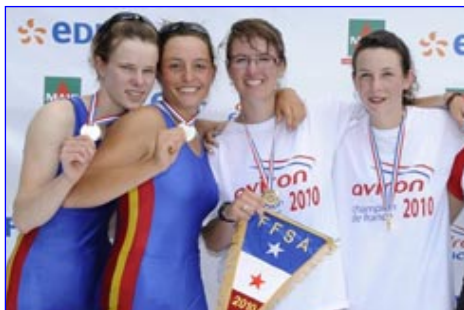
2x Cadettes A. du lac Bleu / CA Evian