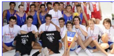
8+ Juniors CA Lyon