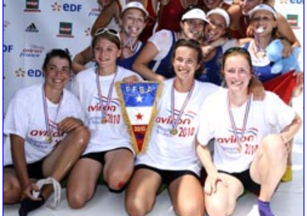
Les photos de cette page : © FFSA