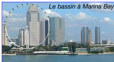
Le bassin à Marina Bay

Félicitations d'avoir représenté, la région Rhône Alpes et la ligue Rhône Alpes d'Aviron. AQ