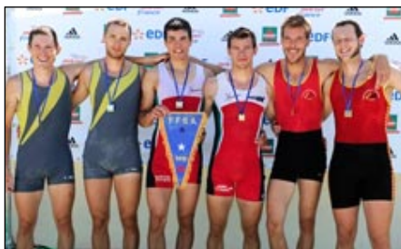
2xHS AUN Villefranche

2xHS AUN Villefranche - 4-HS Av. Grenoble - 8+SH CN Annecy.