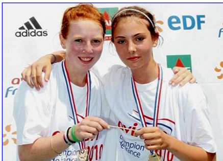
FM2x du CA Lyon

Champions de France Minimes FM2x CA Lyon, HM2x CA Thonon. Médaillé d'argent HM8x+ AUN Lyon, de bronze HM8x+ A Grenoble, HM1x CA Aiguebelette.