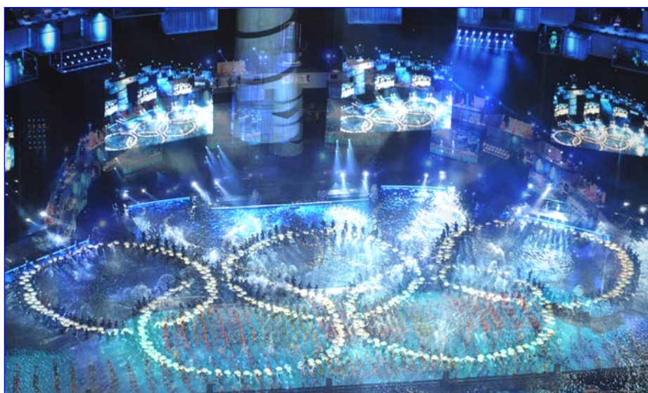
Photo de la merveilleuse cérémonie d'ouverture des Jeux Olympiques de la Jeunesse Singapour 2010 sur la plate-forme flottante de la Marina.