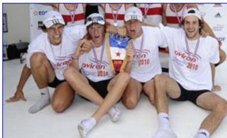
4x Juniors Av Roanne le Coteau